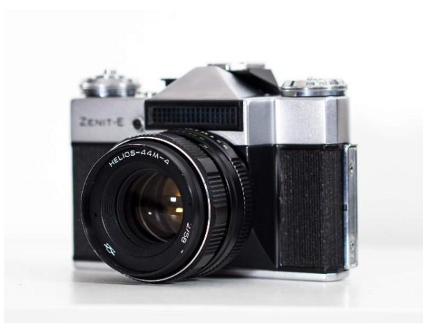
ถ่ายรูปในงานและแชร์บนเว็บไซต์และโซเชียลมีเดียของสโมสร โดยได้รับอนุญาตจากผู้ร่วมงาน