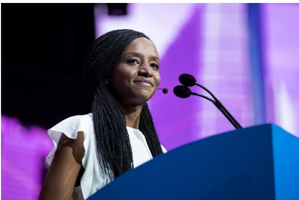
ขอให้ผู้ว่าการภาคเป็นผู้มอบรางวัล

ค้นหาแนวความคิดใหม่ๆ เกี่ยวกับวิธีการเชิดชูเกียรติที่มีความหมายมากยิ่งขึ้น เช่น