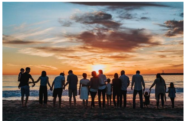
เชิญครอบครัวของผู้รับรางวัลมาร่วมงาน