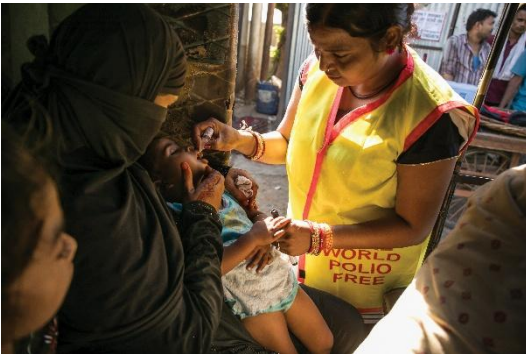
สมาชิกโรตารีหยอดวัคซีนโปลิโอ

การบริจาคให้มูลนิธิจากสมาชิกและผู้สนับสนุนช่วยให้เราสร้างความเปลี่ยนแปลงเชิงบวกที่ยั่งยืนแก่ชุมชนต่างๆ ท่านสามารถสอบถามผู้เชี่ยวชาญด้านมูลนิธิโรตารีของสโมสรหรือเยี่ยมชม rotary.org/donate เพื่อเรียนรู้วิธีสนับสนุนมูลนิธิของเรา และสามารถศึกษารายละเอียดงานของมูลนิธิเพิ่มเติมได้จากเอกสารข้อมูลอ้างอิง: มูลนิธิโรตารี (The Rotary Foundation Reference Guide) หรือหลักสูตร Rotary Foundation Essentials ที่ศูนย์การเรียนรู้ของโรตารี