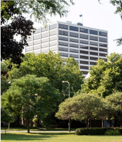
สำนักงานใหญ่โลกโรตารีสากลที่เมือง อีฟเวนสตัน รัฐอิลลินอยส์ สหรัฐอเมริกา

มีบุคลากรของโรตารีซึ่งเป็นที่รู้จักในนาม สำนักเลขธิการ (Secretariat) ทำหน้าที่ สนับสนุนสมาชิก สโมสร ภาค ผู้เข้าร่วม โปรแกรมและศิษย์เก่า ปัจจุบันมีบุคลากร มากกว่า 800 คนปฏิบัติงานอยู่ในสำนักงาน หลายแห่งทั่วโลกเพื่อให้โรตารีสากลและ มูลนิธิโรตารีดำเนินงานได้อย่างราบรื่นมี ประสิทธิภาพ