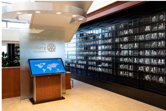
ห้องแสดงภาพสังคัมผู้บริจาค อาร์ช คลัมภ์ บนชั้น 17 ของสำนักงานใหญ่โลกของโรตารีสากล