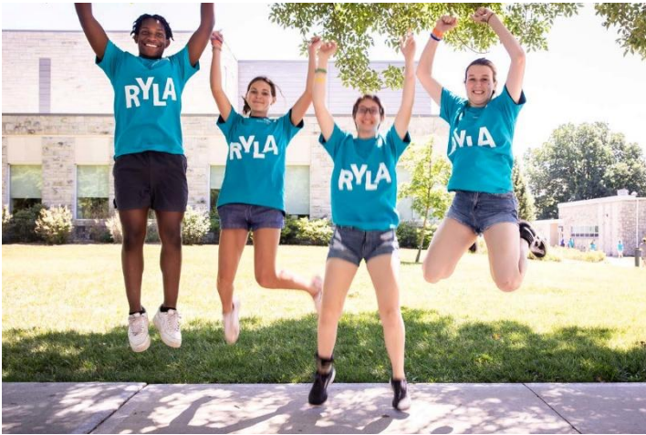
งานกิจกรรมโรลาปลูกฝังคุณค่าแห่งการบริการและความเป็นผู้นำ

ในแต่ละปี มีเยาวชนหลายพันคนได้รับการคัดเลือกให้เข้าร่วมค่ายหรือสัมมนาด้านภาวะผู้นำภายใต้โครงการโรลา กิจกรรมเหล่านี้อาจจัดโดยสโมสรโรตารี ภาคหรือหลายภาค ร่วมกันภายใต้บรรยากาศที่เป็นกันเอง ผู้เข้าร่วมจะใช้เวลาหลายวันในโปรแกรมที่ทำทนายเรียนรู้เรื่องภาวะผู้นำผ่านการแลกเปลี่ยนความคิดเห็นที่มีผู้ดำเนินรายการ สุนทรพจน์ที่สร้างแรงบันดาลใจ และกิจกรรมกลุ่มที่ช่วยส่งเสริมการพัฒนาตนเอง ทักษะการสื่อสาร และความเป็นพลเมืองที่ดี โปรแกรมหรือกิจกรรมโรลาแต่ละแห่งได้รับการออกแบบให้เหมาะสมกับช่วงอายุของผู้เข้าร่วม