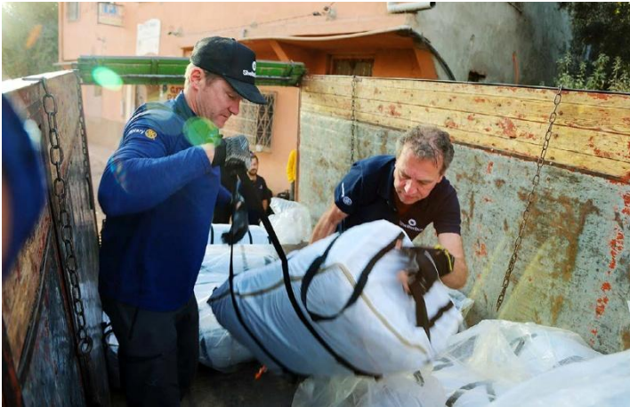
เซลเตอร์บอกซ์และสมาชิกโรตารี แจกจ่ายเต็นท์และสิ่งของจำเป็นเร่งด่วนแก่ผู้ประสบภัยแผ่นดินไหวที่โมร็อกโก ในปี 2023

ศึกษารายละเอียดเพิ่มเติมและดูรายชื่อพันธมิตรของโรตารีได้ที่ rotary.org/partners