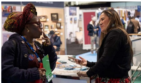
ผู้เข้าร่วมประชุมใหญ่โรตารีสากล ปี 2025

การเป็นสมาชิกโรตารีเปิดโอกาสให้ท่านได้สัมผัสประสบการณ์ระดับนานาชาติ และสร้างความสัมพันธ์กับผู้คนทั่วโลก ไม่ว่าจะเป็นการเป็นเจ้าภาพรับนักเรียนโครงการเยาวชนแลกเปลี่ยน การเข้าร่วมการประชุมระดับนานาชาติ การเยี่ยมสโมสรอื่นในระหว่างการเดินทาง การร่วมมือกับสโมสรในประเทศอื่นเพื่อทำโครงการ