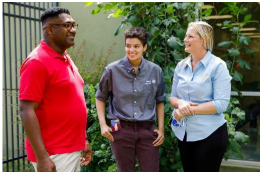
สโมสรจะประสบความสำเร็จสูงสุดเมื่อสะท้อนให้เห็นถึงชุมชนที่สโมสรบำเพ็ญประโยชน์

ด้วยความมุ่งมั่นด้านการอยู่ร่วมกันอย่างมีความสุข เราสามารถเสริมพลังให้ทุกคนก้าวขึ้นเป็นผู้นำและมีส่วนร่วมในพันธกิจของโรดาร์ได้อย่างเต็มที่ มาร่วมกันทำให้มั่นใจว่าสมาชิกทุกคนมีทรัพยากร โอกาส และการสนับสนุนที่จำเป็นต่อความสำเร็จ เมื่อเราโอบรับความเป็นส่วนหนึ่งอย่างแท้จริง เราจะปลดล็อกศักยภาพของทุกคนให้ลงมือทำ และสร้างความเปลี่ยนแปลงที่ยั่งยืนไปด้วยกัน