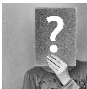
การตั้งคำถามหรือวิพากษ์วิจารณ์เกี่ยวกับประสบการณ์หรือกิจกรรมทางเพศของบุคคลอื่น