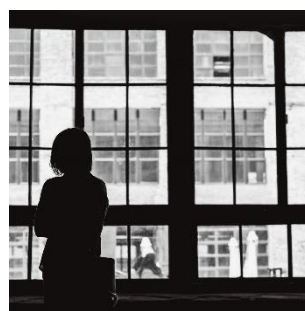
การล้อเลียนหรือใช้ภาษาที่ดูถูกเกี่ยวกับลักษณะเฉพาะที่กล่าวไว้ข้างต้น