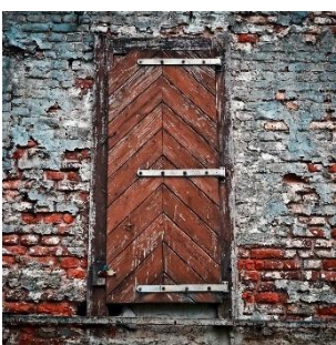
การตั้งใจขัดขวางกิจกรรมของผู้อื่น