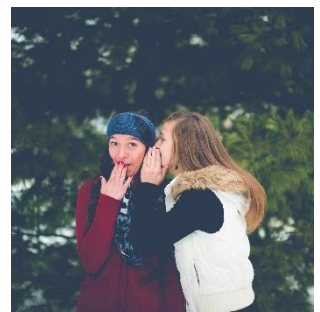
การมีส่วนเกี่ยวข้องในการนินทาว่าร้าย รวมทั้งถ้อยคำที่ดูหมิ่น เหยียดหยาม เกี่ยวกับชีวิตความเป็นส่วนตัวของผู้คนซึ่งอาจจะทำให้เสียชื่อเสียง