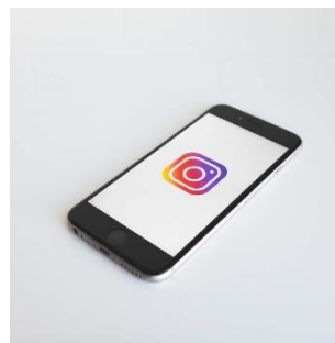
การออกความเห็นในความหมายเชิงดูถูกหรือเหยียดหยามบนสื่อทางสังคมหรือในอีเมล