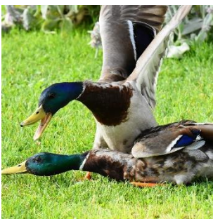
การใช้ถ้อยคำดูหมิ่นเหยียดหยาม ไม่ว่าจะโดยการพูดหรือเขียน รวมทั้งในอีเมลหรือบนสื่อทางสังคม

การคุกคามอาจจะเกิดขึ้นได้ในหลายรูปแบบเมื่อพฤติกรรมหนึ่งเกิดแพร่กระจายหรือรุนแรงขึ้น มันคือการคุกคาม ตัวอย่างเช่น