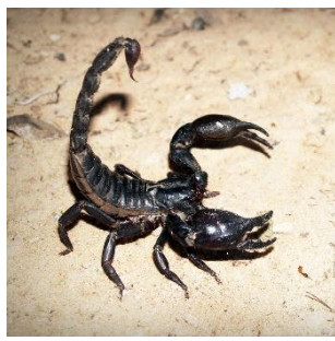
การกลั่นแกล้งผู้อื่นตามลักษณะเฉพาะข้างต้น รวมทั้งการข่มขู่หรือการทำให้กลัวด้วยวาจาหรือทางกาย