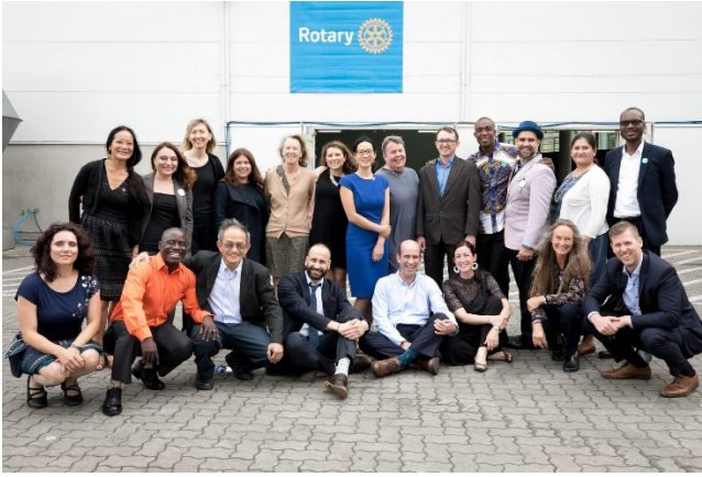
ผู้ร่วมการสัมมนาสันติภาพของโรตารีในการประชุมใหญ่ ประจำปีของโรตารีสากลที่เมืองฮัมบูร์ก ประเทศ เยอรมนี

"พวกเราเชื่อมั่นในความหลากหลาย เพราะโรตารี เชื่อมโยงโลกได้ดีที่สุด และดังนั้น จะต้องสะท้อน ให้เห็นทุกภาคส่วนของมนุษยชาติ ท่านไม่ สามารถจะบำเพ็ญประโยชน์แก่โลกได้อย่าง เหมาะสม หากไม่สามารถมองเห็นและรับฟังโลก ได้อย่างถูกต้อง ความหลากหลายทำให้มั่นใจได้ว่า โรตารีจะเป็นผู้แทนของทุกเสียงและพูดในทุก ๆ ภาษา"