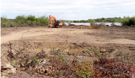
การปรับเตรียมพื้นที่สำหรับพิธีเปิด

เกียรติร่วมเปิดโครงการโดยการขุดดินใส่บั้งก็มอบให้แก่นายก อบต.โพนงามและผู้ใหญ่บ้าน ทั้ง 3 หมู่บ้านซึ่งอยู่บริเวณรอบแก้มลิง แล้วจึงรับประทานอาหารกลางวันร่วมกันโดยชาวบ้าน ทั้ง 3 หมู่บ้านจะเป็นผู้จัดทำอาหารมาร่วมงาน ขอเชิญทุกท่านร่วมพิธีได้ ณ ที่ตั้งโครงการ บ้านเสาวัด ต.โพนงาม อ.อากาศอำนวย จ.สกลนคร